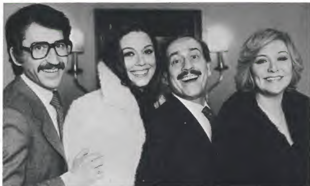
José Sacristán - Mónica Randall - José Luis López Vázquez - Amparo Soler Leal